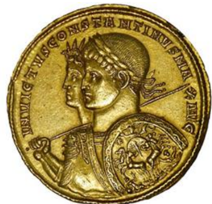
Solidus en or à l'effigie de Constantin I er et du Sol Invictus, (dieu-soleil) - Ticinum (actuelle Pavie), 313, Cabinet des médailles (Beistegui 233).

Nestorius propose une solution de compromis avec Christotokos (« mère du Christ »). Nestorius considérait en effet qu'une femme créée ne pouvait être la mère de Dieu, « être par excellence et donc sans cause » https://fr.wikipedia.org/wiki/Nestorius