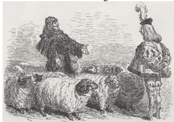
Dingdong et Panurge

Il faut de la réflexion, mais aussi de l'inspiration venant du 'Souffle Saint, d'En-Haut' pour être et demeurer dans la Vérité et la Lumière bibliques, et ne pas être des 'Les moutons de Panurge'