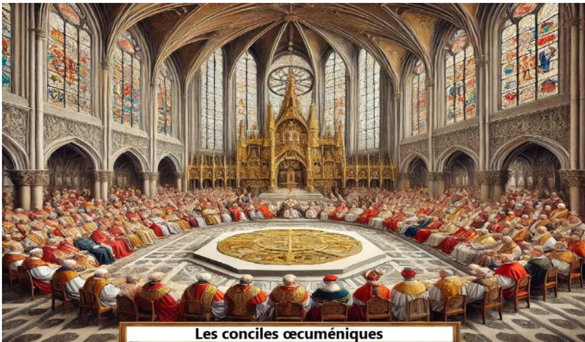
Les conciles œcuméniques

Les bases actuelles de beaucoup de 'mouvements religieux dits chrétiens sont :